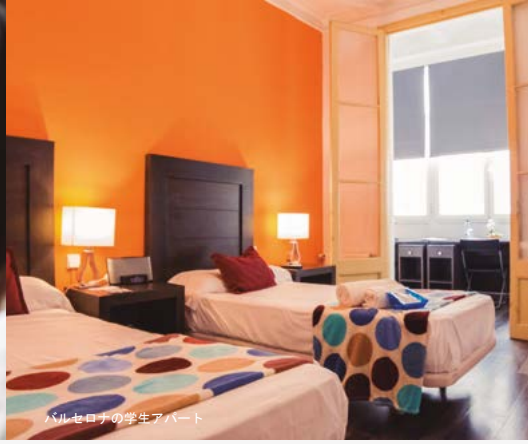
バルセロナの学生アパート