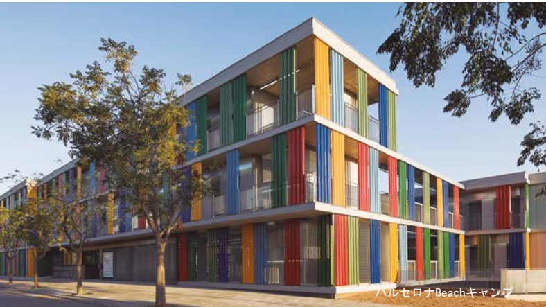
バルセロナBeachキャンプ