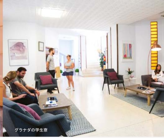
グラナダの学生寮

留学中に心地よい宿泊施設に滞在することは重要な事です。本校は留学中に滞在する宿泊地の質の重要性を理解しています。お客様が安全で心地が良くそして不自由のない生活ができるようサポートします。