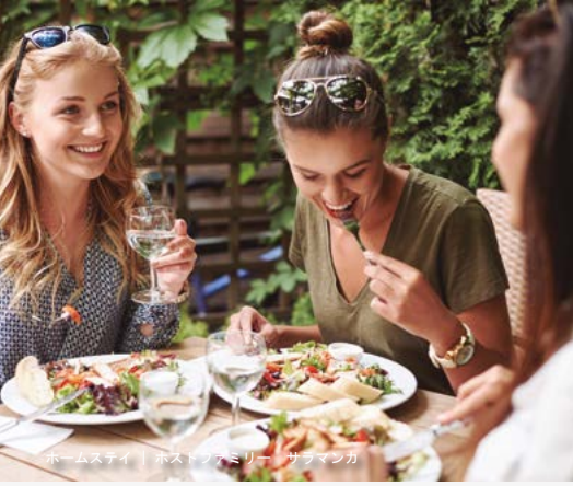
ホームステイ | ホストファミリー | サラマンカ