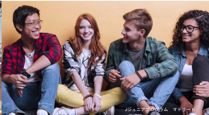
Jジュニアプログラム マドリード